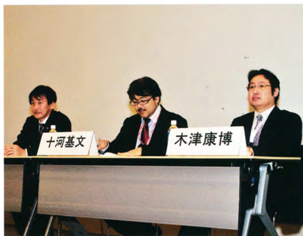
ミニシンポジウム「コンピュータガイディングシステム」 2月12日