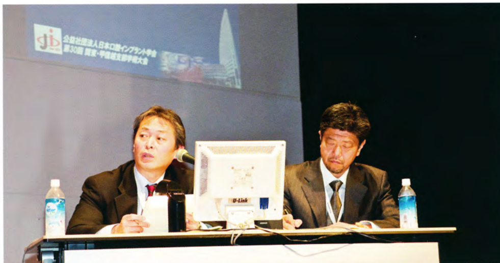
エンディングシンポジウム『30年の歩みと未来に向けての討論会』 2月13日