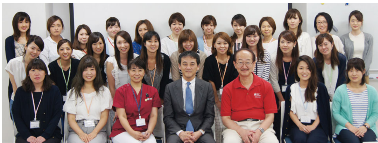
ハイジニストコース