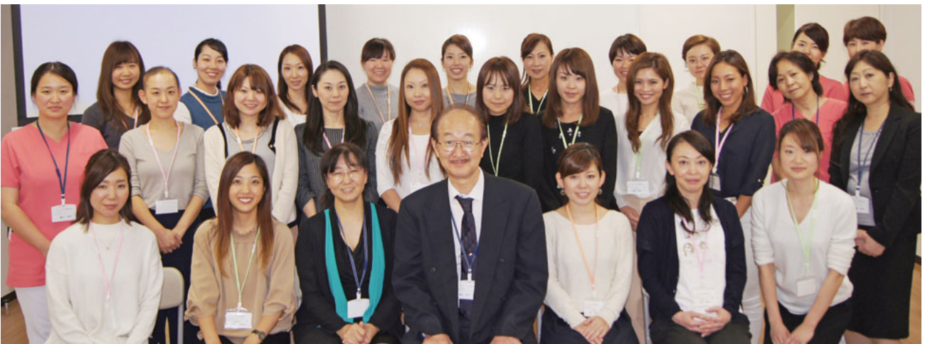
アドバンスコース